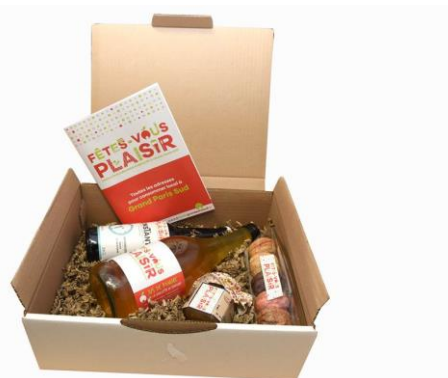
La box « Fêtes-vous plaisir »