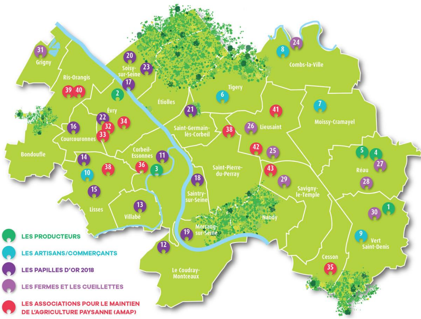
La carte des adresses pour consommer local à Grand Paris Sud