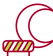
Fermeture pour travaux pendant la nuit