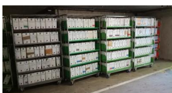
Déménagement des archives du SAN de Sénart-en-Essonne