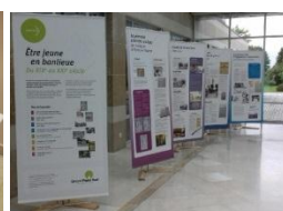
Exposition "Être jeune en banlieue du XIXe siècle au XXIe siècle"