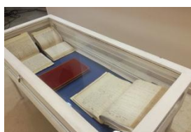
Journée internationale des archives : présentation des registres d'état civil de la Ville d'Évry (XVIe-XIXe siècle)